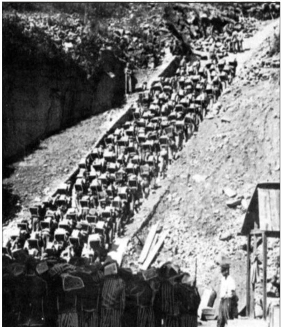
Die berühmte Todesstiege im KZ Mauthausen

terndes Opfer der Solidarität und Kameradschaft überliefert: Auf der Todesstiege in Mauthausen war ein Kamerad, größer und stärker als er, unter der Last eines großen Granitsteines zusammengebrochen. Er nahm den Stein des Genossen auf sich und trug ihn hinauf über die granitene Höllenleiter. Als ihm im März 1944 ein Sohn geboren wurde, betrachtete er sinnend die Händchen des Kleinen. Der Bub habe schöne, gerade Finger, sagte er, vielleicht könnte er einmal ein ausübender Musiker werden. Und dafür, daß die Weltfreundlicher sei, ist er in Mauth-