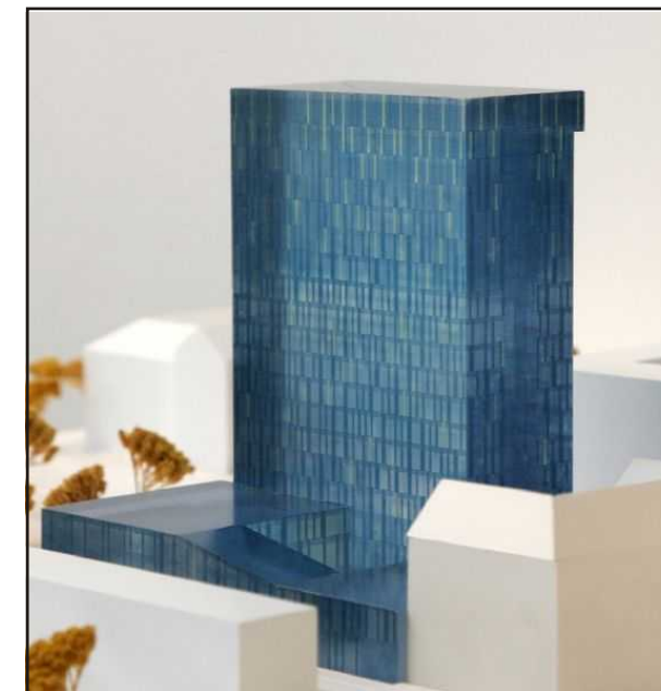
Modell der neuen Zentrale der Energie AG

Daher: Keine Privatisierung, kein Börsegang, kein Ausverkauf!